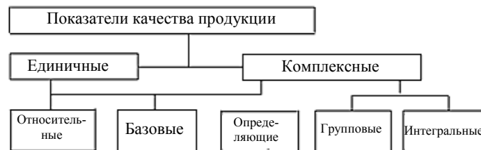
Рис. 1. Классификация показателей качества продукции

Проанализировав классификацию показателей качества продукции (рис. 1), можно делать вывод о том, что интегральный показатель является частным случаем комплексного показателя. Интегральный показатель качества характеризует отношение суммарного полезного эффекта при эксплуатации данного продукта к суммарным затратам на его приобретение, эксплуатацию или потребление [8].